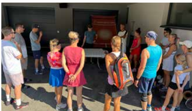
Spielbesprechung Bier & Prosecco-Cup